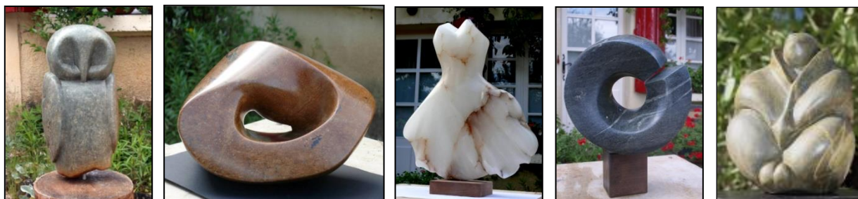
werk van cursisten

Beginners én gevorderden krijgen ondersteuning op maat, creatief en technisch. De steen is niet bij de prijs inbegrepen, gedegen advies bij de aanschaf wel. Alle beeldhouwweken worden afgesloten met een expositie met het werk van de deelnemers. Daarbij heffen we een glas om het bereikte resultaat te vieren.